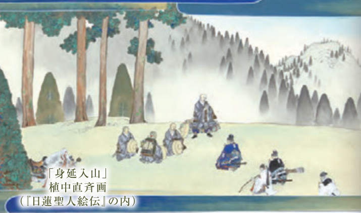
「身延入山」 植中直斉画