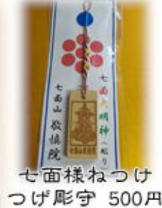
七面様ねつけつけ彫守 500円

一位数珠 茶房・紫房各二色 八寸 5,000円 一尺 6,000円 一尺二寸 8,000円