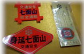
交通安全ステッカー 各種 300