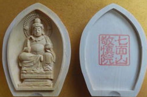
七面大明神様 香合仏 10,000円