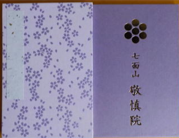
御朱印帳 (大) 1,500円