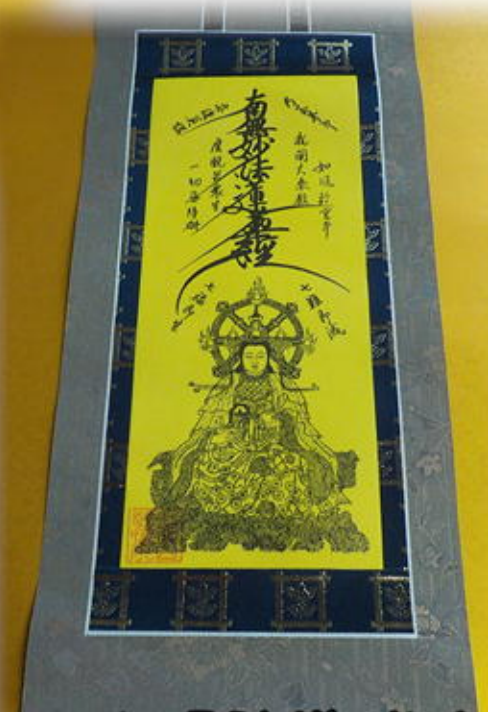
七面大明神様 掛軸 (小) 7,000円 (大) 27,000円