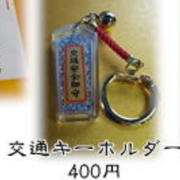
交通安全キーホルダー 400円