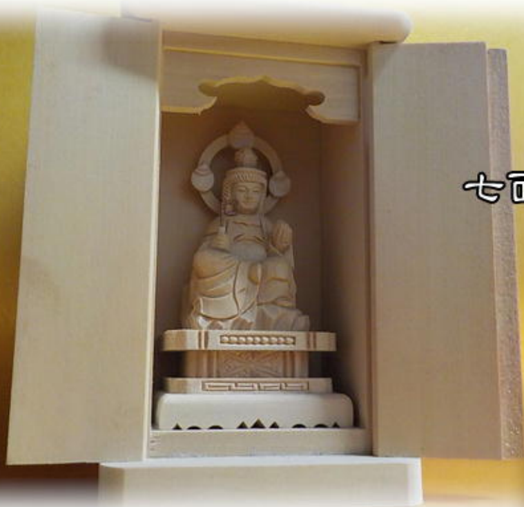
七面大明神様 御分体 47,000円